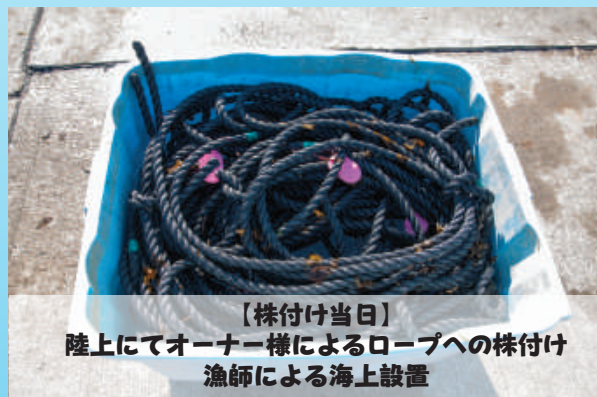
【株付け当日】 陸上にてオーナー様によるロープへの株付け 漁師による海上設置