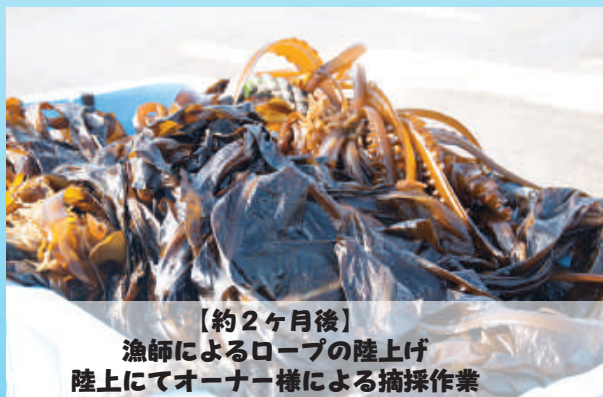
【約2ヶ月後】 漁師によるロープの陸上げ 陸上にてオーナー様による摘採作業